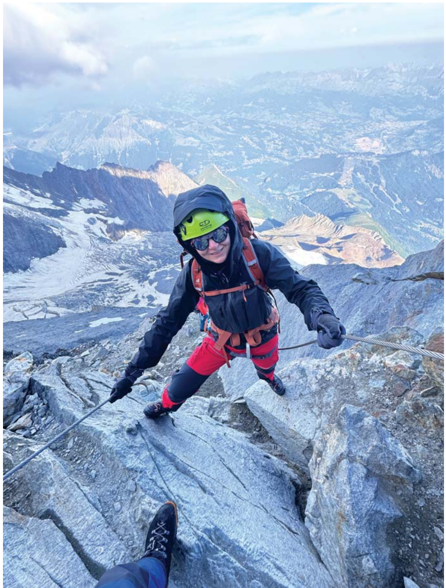
Zejscie od strony schroniska Gouter, droga klasyczna.

Jeśli chodzi o aklimatyzację, to nie miałam większych problemów, oprócz lekkiego bólu głowy, w skali Lake Louise AMS od zera do trzech miałam jeden. Objawy bólowe ujawniały się w ciągu pierwszych trzech dni aklimatyzacji, ale byłam w stanie je zniwelować lekami przeciwbólowymi, więc kompletnie mi nie przeszkadzały. Jak Pani wspomniała, mieszkam prawie na terenie depresyjnym, więc uważam, że mój organizm poradził sobie świetnie, co bardzo mnie ucieszyło, bo przygotowywałam się do tej wyprawy prawie pięć miesięcy, a jak wiadomo w procesie aklimatyzacji bardzo często nie ma znaczenia nawet stopień wysportowania, czy siły, bo można biegać maratony, a na wysokości trzech, czterech tysięcy naprawdę cierpieć katusze.