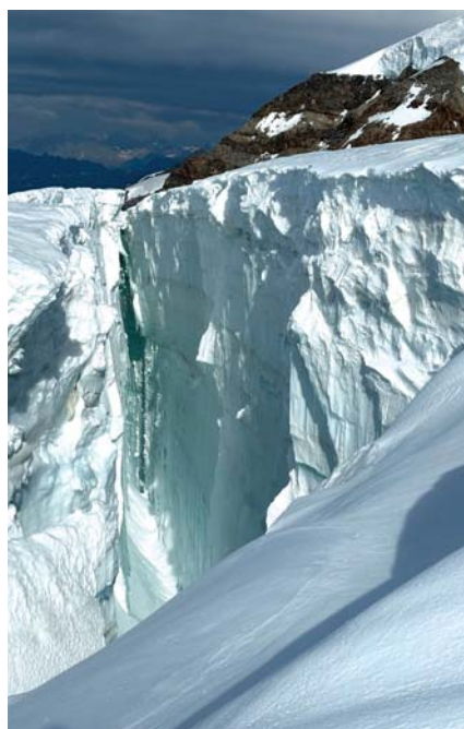
Potężna szczelina na lodowcu w drodze na Piramide Vincent.