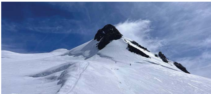
Widok z lodowca na szczyt.