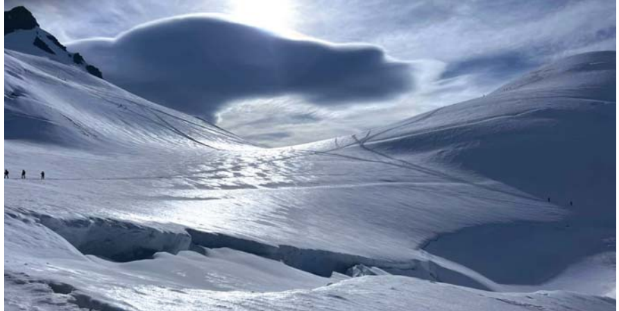
Widok na okazały lodowiec w masywie Monte Rosa.

Stając na Mont Blanc byłam z siebie bardzo zadowolona i potwierdziłam moje umiejętności oraz przygotowanie do dalszej przygody z górami wysokimi, bo plany są i już zaczynam przygotowania fizyczne z moim trenerem i kompletowanie sprzętu do Pakistanu na zdoby-