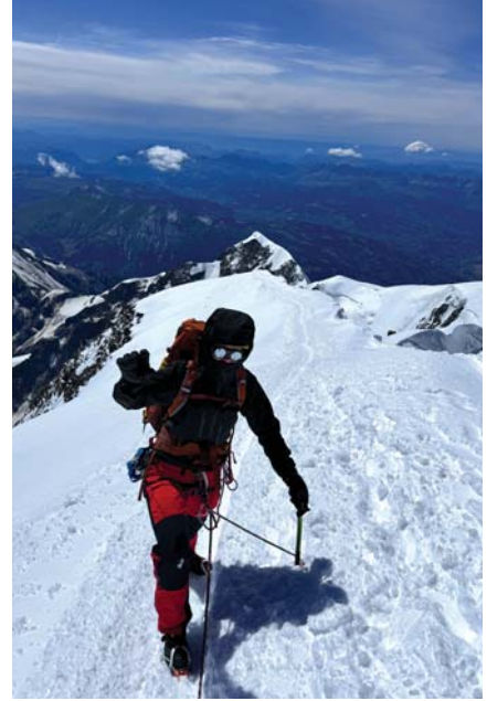
W drodze na Mont Blanc.

Tuż przed wyprawą złamała Pani palec u prawej stopy. Czy może Pani opowiedzieć, jak wyglądał proces radzenia sobie z bólem i kontuzją w tak ekstremalnych warunkach?