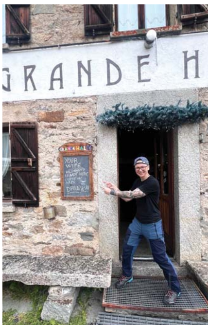
Schronisko Grande Halte 1945 m n. p. m.

Czy fakt, że jest Pani lekarką weterynarii, pomógł Pani w jakikolwiek sposób w ocenie i radzeniu sobie z objawami choroby wysokościowej?