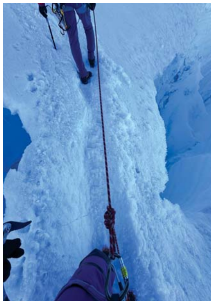
Most nad szczelina podczas drogi na Mont Blanc.