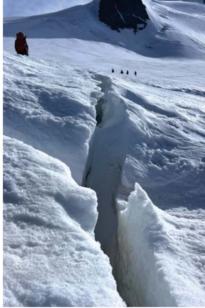
Szczelina na lodowcu.