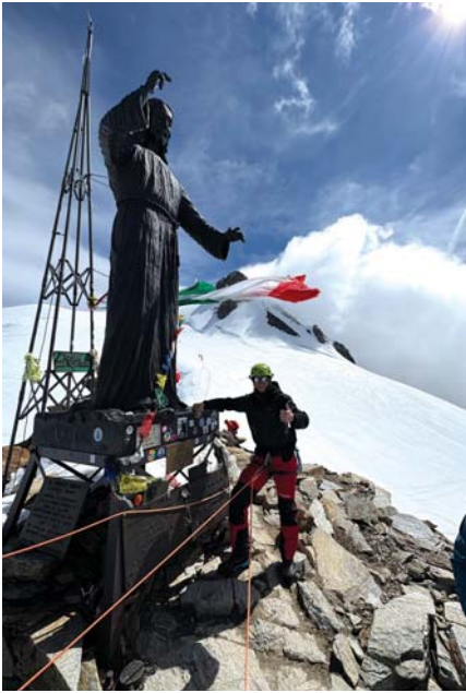
Szczyt Balmenhorn 4167 m n. p. m.